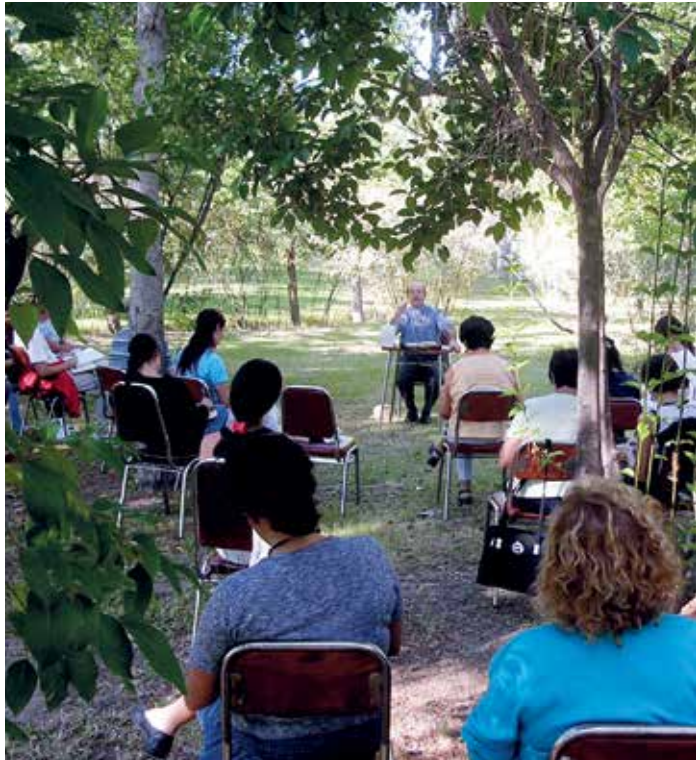
Foyer de Charité de Medrano - Argentine

Vous vous posez des questions sur la foi chrétienne, sur la spiritualité ?